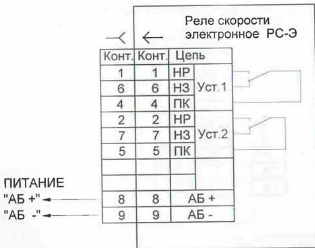
Рисунок 6. Схема соединения РС-Э-10, РС-Э-11, РС-Э-13