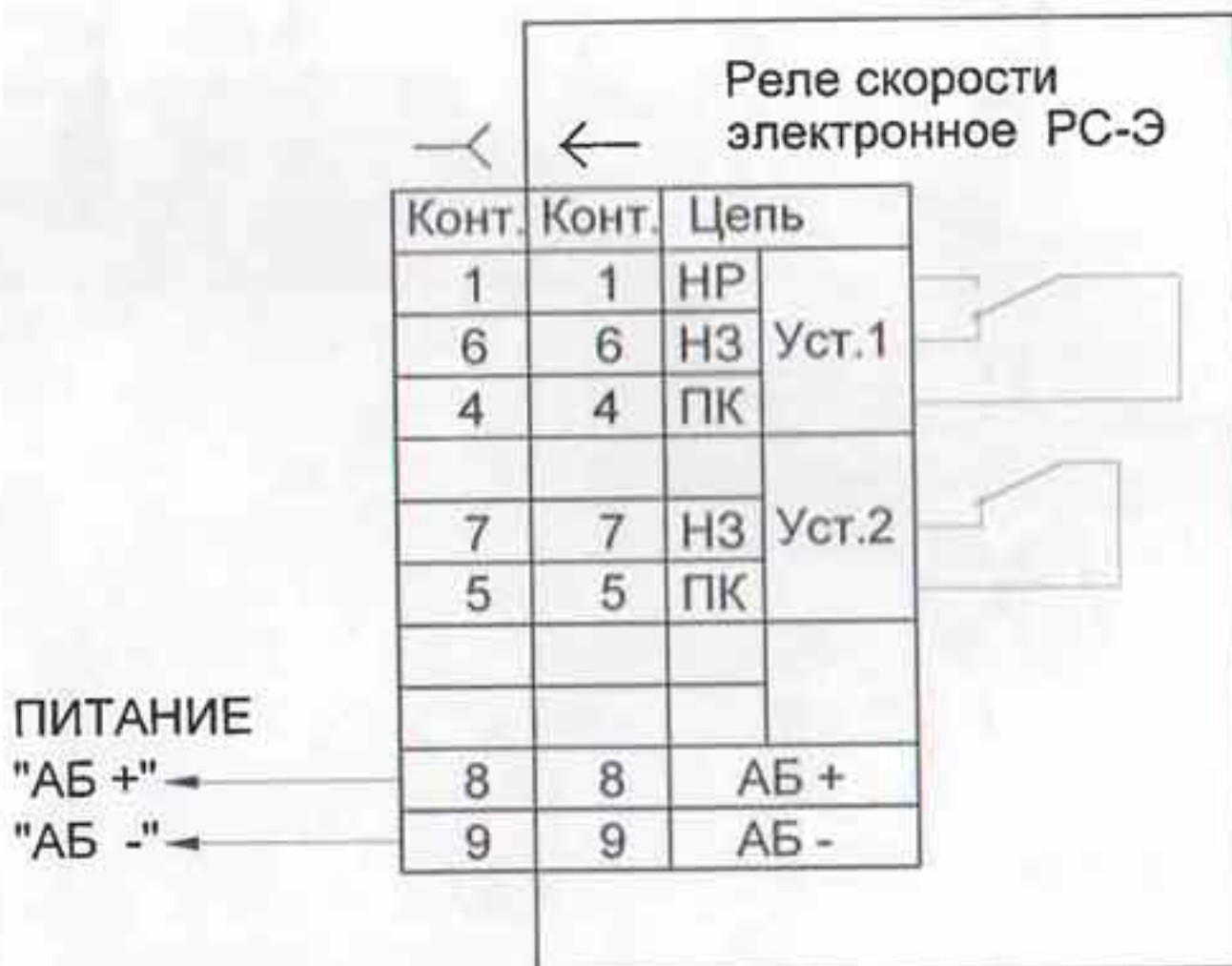
Рисунок 3. Схема соединения РС-Э-3